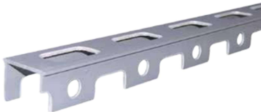
Figure 1 : Vue 3D